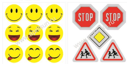
Набор наклеек "Улыбка" 9 элементов 3*3 см*9 шт