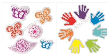
Набор наклеек "Бабочка" 6 элементов в наборе Размеры: 3*3см*3 шт и 2*2 см* 1 шт 6*4см*1 шт